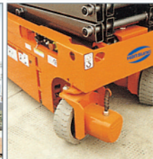
◀ Tight turning radius