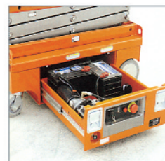
Easy out tray ▲