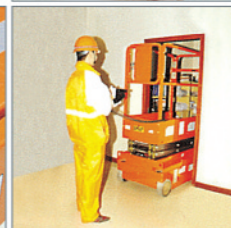
◀ Compact size