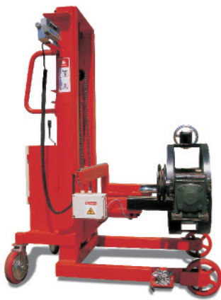
▲ 전자저울 부착형