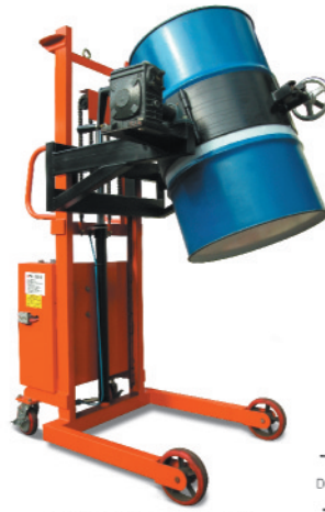
▲ 유압전동식 HDL-3E