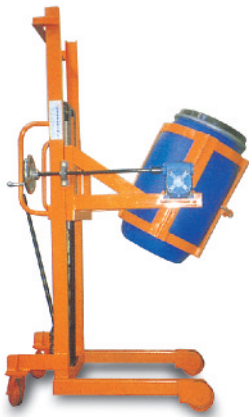
▲ 유압수동식 HDL-3M